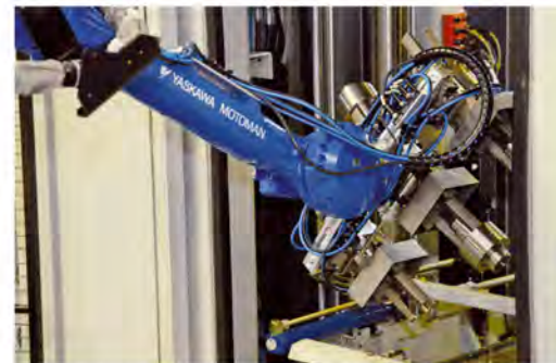
Das Be- und Entladen der Räummaschine erledigt ein großer Sechssacher vom Typ MOTOMAN MH50 mit einem Doppel-Dreifach-Greifer auf besonders elegante Weise.