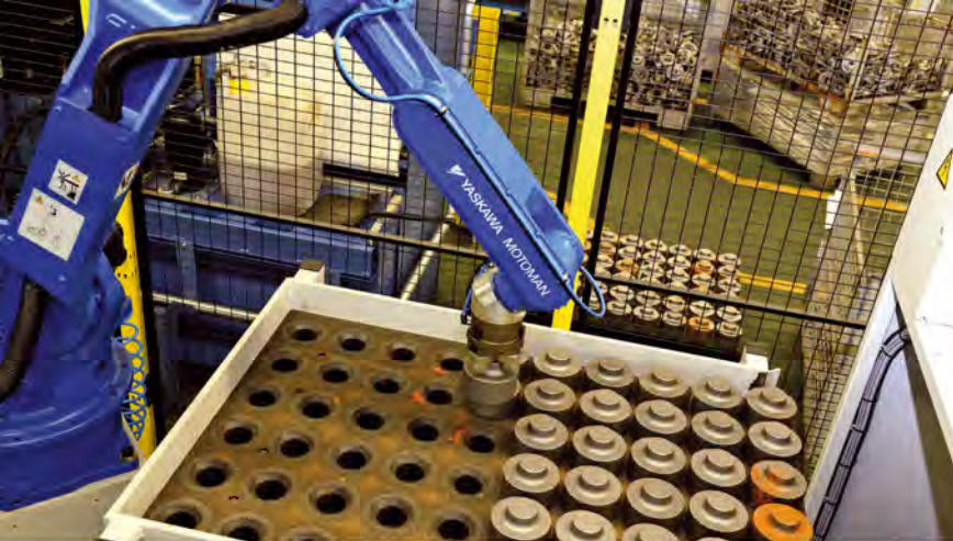
Ein MOTOMAN HP20D übernimmt einen Rohling aus der Palette und übergibt ihn an das Drehzentrum.